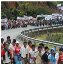
Des Indiens marchent sur Cali, 21 octobre 2008

Des membres des communautés indigènes manifestent violemment dans tout le pays depuis le 10 octobre. Ils reprochent à l'Etat de bafouer leurs droits et de cautionner les assassinats dont ils sont victimes.